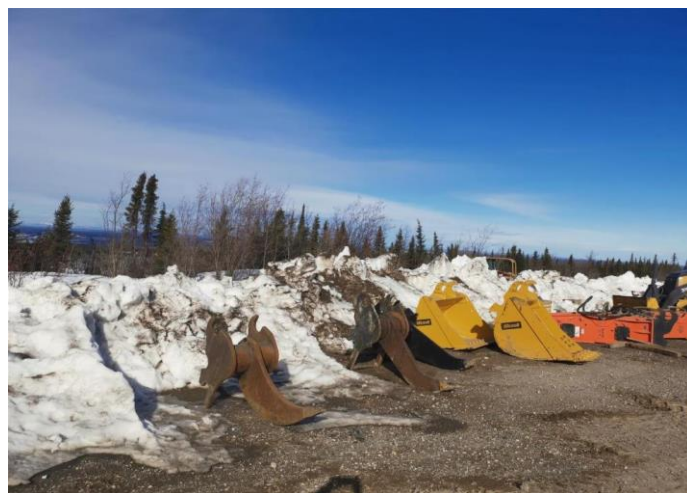
Accessoires divers pour installer les conduits.