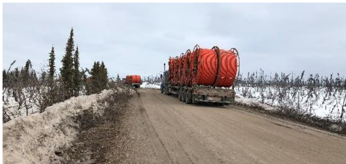
Transport de matériaux jusqu'au site.