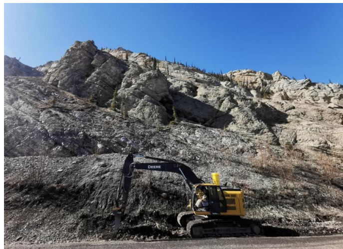
Préparation à l'installation de conduits par l'équipe d'excavation.

Au cours de cette saison de construction, nous avons remis des rapports mensuels aux Premières Nations et aux groupes autochtones des territoires traditionnels touchés par les travaux. Comme la charge de travail prévue a augmenté, la surveillance environnementale sera intensifiée tout autant.