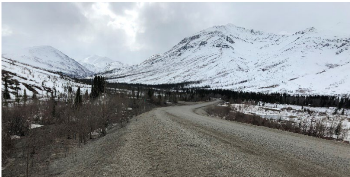
Montagnes enneigées le long de la route Dempster.

Les travaux de construction saisonniers ont pris fin à la fin octobre. Avec l'arrivée de la neige et des températures plus froides, les équipes se sont concentrées sur la fermeture des camps et la préparation de la saison de construction 2023.