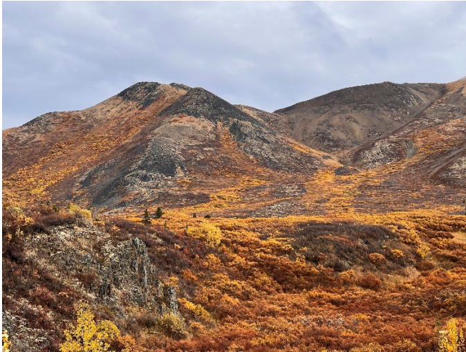
Couleurs d'automne le long de la route Dempster.